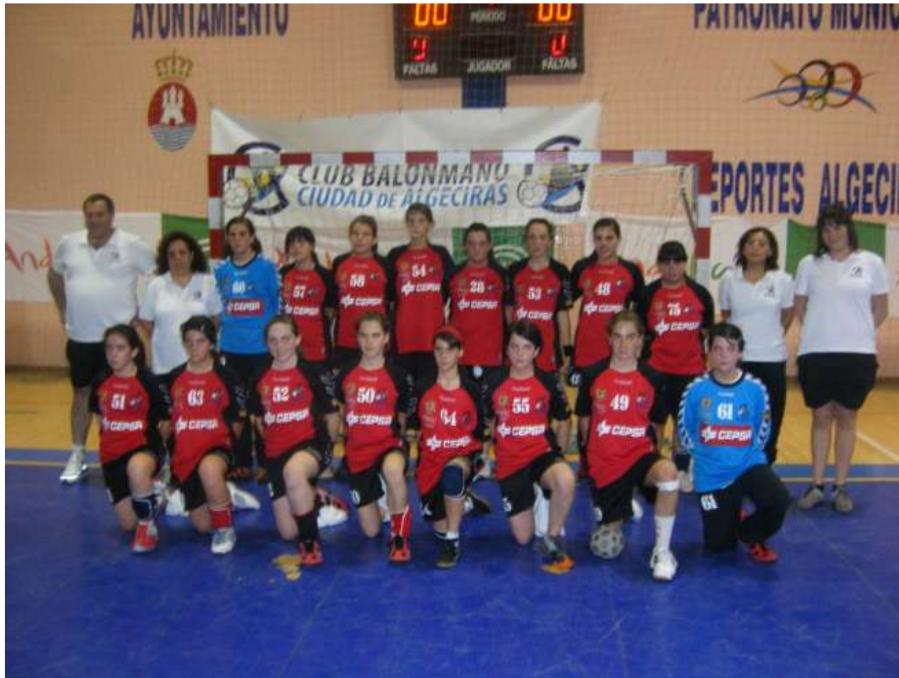
BM CIUDAD DE ALGECIRAS