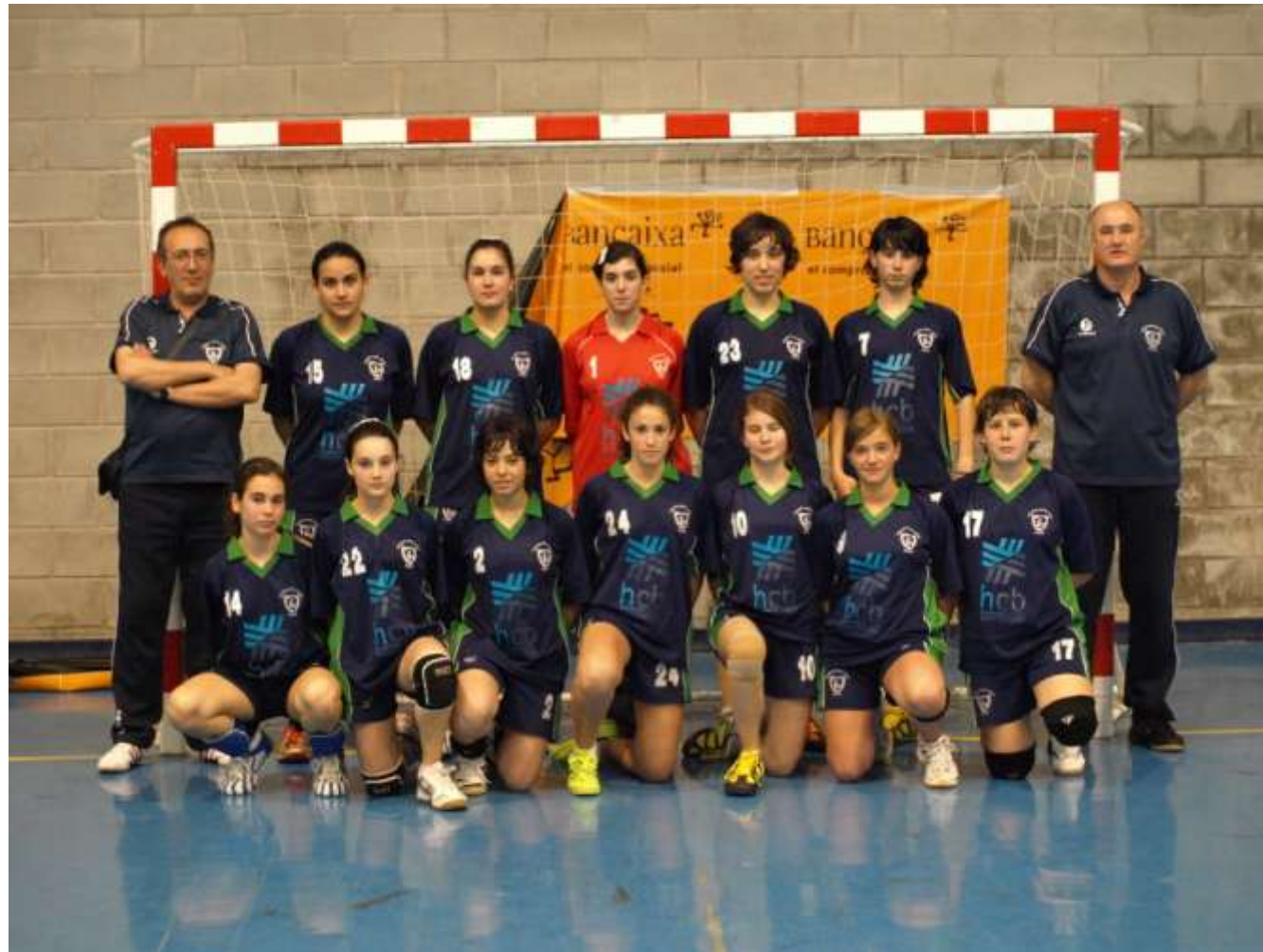
SANTA MARIA ELCHE