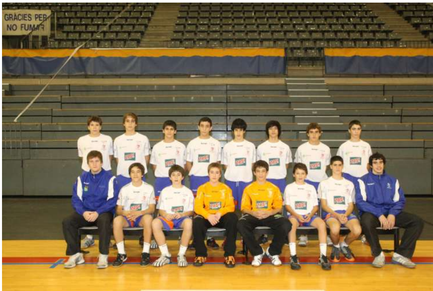
KH-7 BM GRANOLLERS