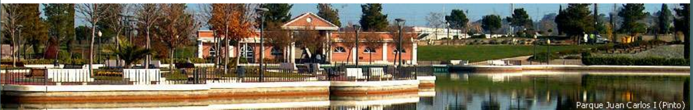
Parque Juan Carlos I (Pinto)