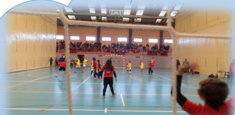
BALONMANO Y MULTIDEPORTE

De LUNES a VIERNES de 8:00 (con desayuno) a 16:00h. Pab. El Cerro