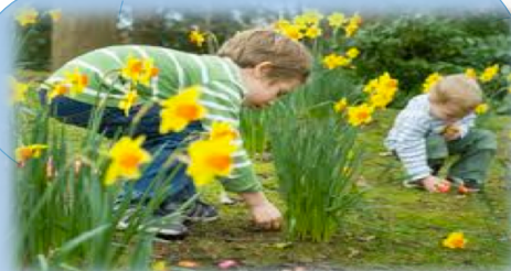
ACTIVIDADES EN LA NATURALEZA